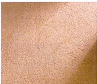
写真1 マჯョーレ。テクスチュアはエキストラフィン(細目)

原産国…イタリア 材料の種類…無機質水系内外装材 材料構成…シリカ、ライム、クオーツなどの無機質系、水系の材料 対応部位…内外装 製品概要…骨材が3種類のシリカ系左官材マჯョーレ、鏝やヘラを使用しベネチアンスタッコ風の仕上げをするコモ・マルモリン、ライム系塗材のイゼオ、ローラーや刷毛を使用する塗装材ガルダがある。13色の標準色を揃える 施工方法…金鏝、スポンジ鏝、ブラシ、ローラー刷毛などで仕上げる。調色はすべてメーカーで行い、納品される 価格…設計価格3千200円/㎡(マჯョーレ・エキストラフィン)。その他…基本的なパターンが少ないもの、かえてアレンジしやすい。