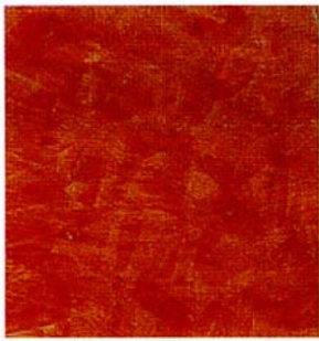
写真1 ベネツィアースタッコ・アンティコ仕上げ(ドゥカーレ※1)

バブル初期にごく一部で使用された輸入左官材も、20年近くの時を経て建築業界一般に認知され定着してきたようである。これらの材料の大部分はイタリアからの輸入であったが、近年ではイタリアだけでなくフランス、イギリス、スペインなどさまざまな国から、初期の仕上げ材はスタッコアンティコ(水溶性漆喰特殊金ペラ仕上げ)と総称される磨き仕上げが主で、ほとんど鏡面状ともいえる