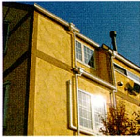
写真2 漆喰系の「モノブラル」(ゲータハウス※2)。塗り厚が6~15mmと厚塗り仕上げ

バブル初期にごく一部で使用された輸入左官材も、20年近くの時を経て建築業界一般に認知され定着してきたようである。これらの材料の大部分はイタリアからの輸入であったが、近年ではイタリアだけでなくフランス、イギリス、スペインなどさまざまな国から、初期の仕上げ材はスタッコアンティコ(水溶性漆喰特殊金ペラ仕上げ)と総称される磨き仕上げが主で、ほとんど鏡面状ともいえる