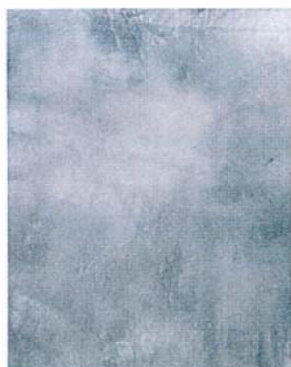
写真1 イタリアの代表的な漆喰である、ミラノのミックストーン仕上げ